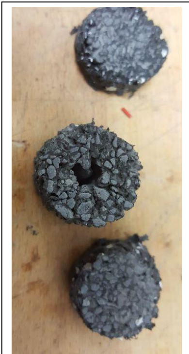
Abb. 2: Foto von Basalthülle

Klar war, dass unser Hauptaugenmerk auf die Basaltproben gerichtet sein musste. Konnten Bakterien im All überleben, weil ihnen Gesteine ähnlich dem Basalt einen Schutz vor der kosmischen Strahlung bieten? Unsere Aufgabe war also, Basalt so zu „formen“, dass er die Bakterien schützt.