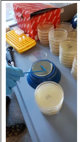
Abb. 6: Foto vom Ausplattieren der Bakterien