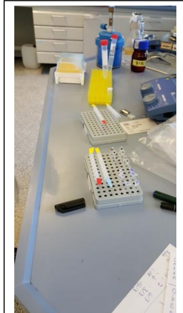
Abb. 5: Foto von den „abgefüllten“ Bakterien

Als nächstes begannen wir bereits mit dem Abfüllen der Bakterien. Verwendet wurde der Stamm W1485, welcher über Nacht bei 37°C in LB-Medium angezogen wurde. In jedes Eppendorfgefäß wurden steril je 100 µl der „Übernacht“ (ÜN)-Kultur überführt. Einige der entsprechend gekennzeichneten Proben wurden mit 7% DMSO versetzt. Zu Proben, die nicht mit DMSO versetzt wurden, wurden weitere 7 µl LB Medium zugegeben. Um alle löslichen Verunreinigungen aus dem Basaltsand zu entfernen, wurde dieser mehrmals in destilliertem Wasser gewaschen. Dann wurde er 1-mal mit Ethanol gewaschen. Letzteres wurde mit Aqua dest. ausgewaschen. Mit diesen Basaltkörnern wurden einigen Eppendorf Reaktionsgefäße befüllt. In jedes Eppendorfgefäß wurden steril je 100 µl der ÜN-Kultur +/-DMSO gegeben. Alle Proben wurden über Nacht im Kühlschrank gelagert. Damit wir die Proben nachher noch unterscheiden konnten, wurden diese entsprechend markiert und wir notierten uns selbstverständlich genauestens die Anordnung/Markierung der Proben. Aus praktischen Gründen zur Befestigung nutzten wir hier, natürlich abgesehen von den Basaltproben, 0,2 ml Eppendorf Reaktionsgefäße in 12 Streifen anstatt einzelner Gefäße. Alle Proben wurden über Nacht im Kühlschrank gelagert.